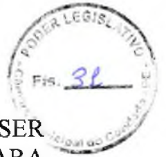
TABELA DE VENCIMENTOS DOS FUNCIONÁRIO PARA SER PARTE INTEGRANTE DA RESOLUÇÃO 001/2016 DA CÂMARA MUNICIPAL DO CONDADO-PE.