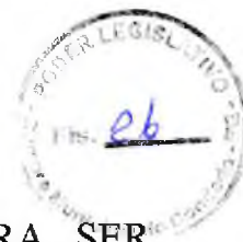
TABELA DE VENCIMENTOS DOS FUNCIONÁRIO PARA SER PARTE INTEGRANTE DA RESOLUÇÃO 001/2016 DA CÂMARA MUNICIPAL DO CONDADO-PE.