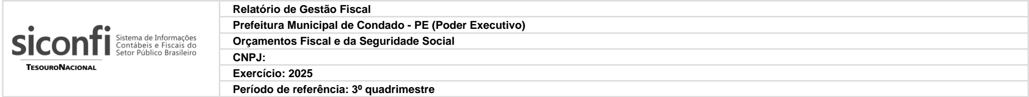
RGF-Anexo 02 | Tabela 2.0 - Demonstrativo da Dívida Consolidada Líquida - Estados, DF e Municípios